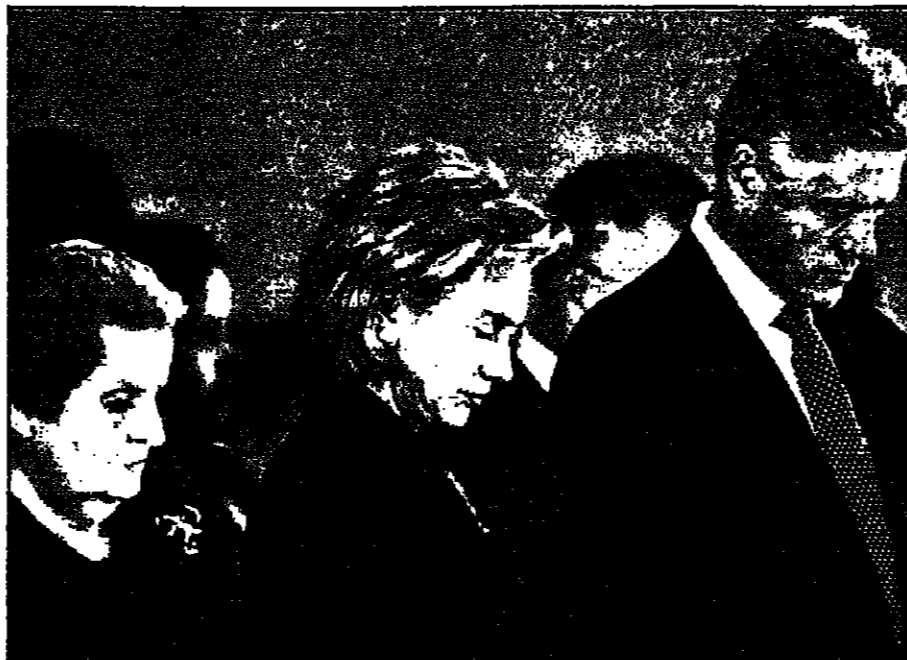
الرئيس بيل كلينتون زوجته ميلاري ووزيرة الخارجية مادلين اولبرايت أثناء تباين تكي الانفجار في واشنطن لس

نيروبي - اف. ب. ب: كشفت السفيرة الأمريكية في كينيا برونش بوشلين الاربعاء لحظة للثنيين سبب في انه ان السفارة تعرضت للنهب بعد جرح ضابط من الاعضاء عليها بالسيارة المفخومة التي وقع 248 قتلى ونحو خمسة الاف جريح. واوضحت بوشلين في مؤتمر صحفي في سفارة امريكيها 32 كينيا من العاملين في السفارة. الان الجرحى ولكن في هذا الوقت، محفل انشخص اللثني في دقائق وراحوا بنهبون. واكدت ان ما بين 220 الى 230 شخصا كانوا داخل السفارة عندما انفجرت السيارة المفخومة عند مدخل الوقت في الطابق الارضي. واسفر الانفجار عن مقتل 12 امريكي و32 كينيا من العاملين في السفارة. وانتقد الكينيين مشاة البحرية الأمريكية لتفكيك حراسة الليني لانهم ادخلوا السفارة الا ان السفارة ادعت ان الجنود الامريكين كانوا يهتمون بابعاد الناس عن السفارة لانهم كانوا يخشون انفجارا آخر كان من المحتمل ان يتخذ سببا وجود 13 الف ليستر من المآزق تستخدم لتفجير سفارات الكويتية في الطابق الارضي.